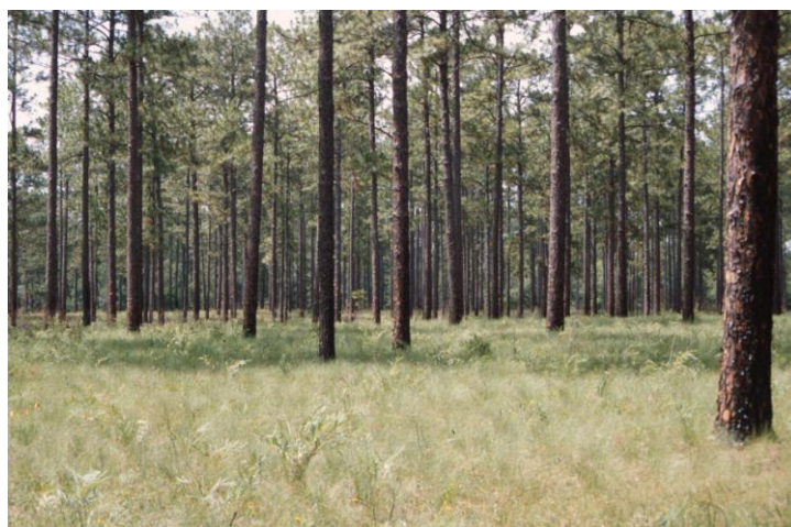
Los proyectos de pequeña escala deberían representar una alternativa forestal viable para las comunidades de bajos ingresos

escala con la especie de Pinus radiata es de 400 ha. De llevarlo a cabo se asumirían 120 mil dólares en costos de transacción y de 300 mil más en administración. Haciendo un total mínimo de 420 mil dólares para la vida total del proyecto (acá se han considerando todos los costos del proyecto MDL). Un ejemplo similar es planteado por Schlamadinger et al. (2007), asumiendo costos de transacción mucho más conservadores (US$105.000) a los estimados por Chile, encontraron que la actividad de pastoreo en el sur de Kenia provee de los mayores ingresos netos por hectárea al compararlo con el valor presente neto (VPN/ha), del proyecto forestal de pequeña escala (asumiendo un valor de 4 dólares por tonelada CO 2 eq, y una tasa de descuento del 12%) (Tabla 3). Por tanto, para llevar a cabo el proyecto MDL de este tipo de proyectos sin exceder el tope máximo de las ocho mil toneladas, se deberá incurrir en costos similares a los proyectos de gran escala, de esta forma, se hace poco rentable y no atractiva la alternativa forestal para las comunidades de bajos ingresos.