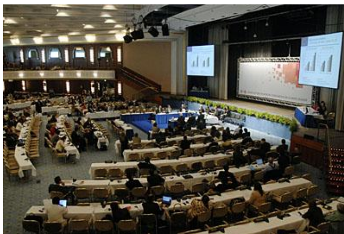
La próxima reunión del Grupo de Trabajo de proyectos de pequeña escala bajo el MDL será entre el 11 y 13 de febrero del 2008. (tomado de http://unfccc.int )

habitan (con la excepción de ciertas comunidades indígenas a las que se les ha reconocido el derecho sobre sus tierras ancestrales), falta de recursos económicos para establecer modelos forestales productivos. Por otra parte, las definiciones de reforestación y aforestación establecidas para proyectos MDL, excluye áreas recientemente deforestadas (desde 1990), en las cuales habitan poblaciones marginales.