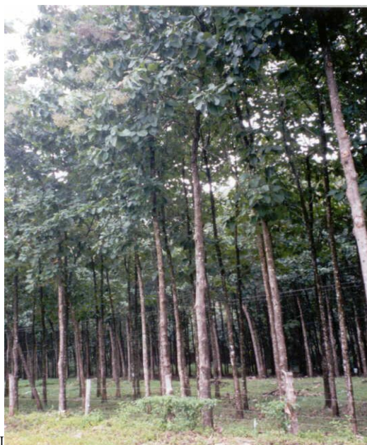
El proyecto PROCUENCA realiza programas de formación en cultura forestal para jóvenes y líderes empresariales rurales

En ese orden de ideas queremos ser promotores de liderazgos colectivos más que individuales para la creación de empresas asociativas de trabajo en torno a la actividad forestal, para encontrar oportunidades económicamente viables que les permita a las generaciones futuras permanecer en el campo y mejorar su calidad de vida.